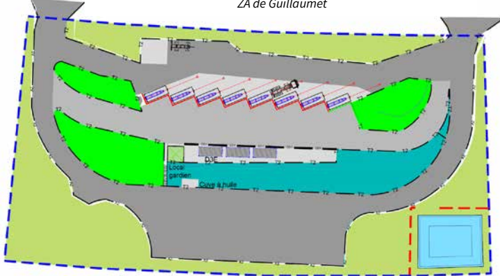
Aménagement de la déchetterie de Grenade sur l'Adour ZA de Guillaumet

Cette opération a débuté par un état des lieux des équipements en place sur chaque commune en vue de définir les besoins réels en la matière et d'étudier un plan de financement pour ce projet.