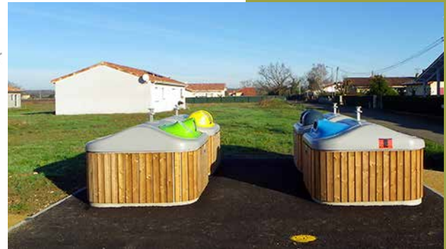
Des conteneurs semi-enterrés