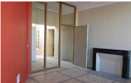
Les nouveaux bureaux, alliant modernisme et conservation d'éléments anciens, ici le parquet et la cheminée

L'Office de Tourisme qui œuvre à la valorisation des spécificités du territoire permettra aux visiteurs d'appréhender la richesse de cette bastide du 14ème siècle et de s'approcher de l'Adour.