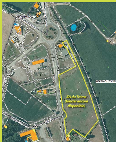
Vue aérienne de la zone d'activités du Tréma