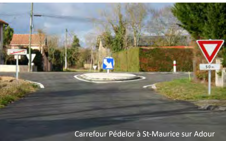
Carrefour Pédolor à St-Maurice sur Adour