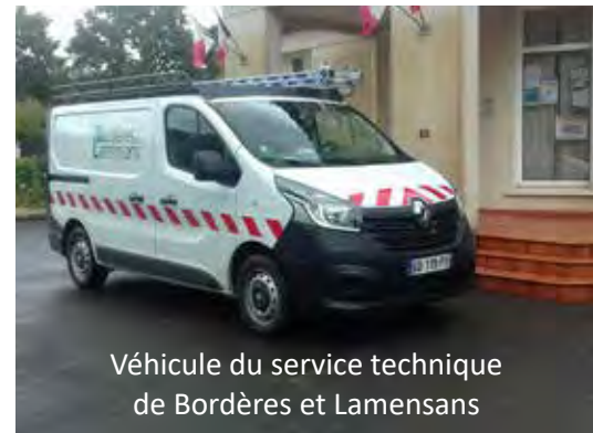
Véhicule du service technique de Bordères et Lamensans

immeuble dont le fonctionnement incombe directement aux communes et représentant un intérêt patrimonial, historique ou touristique.