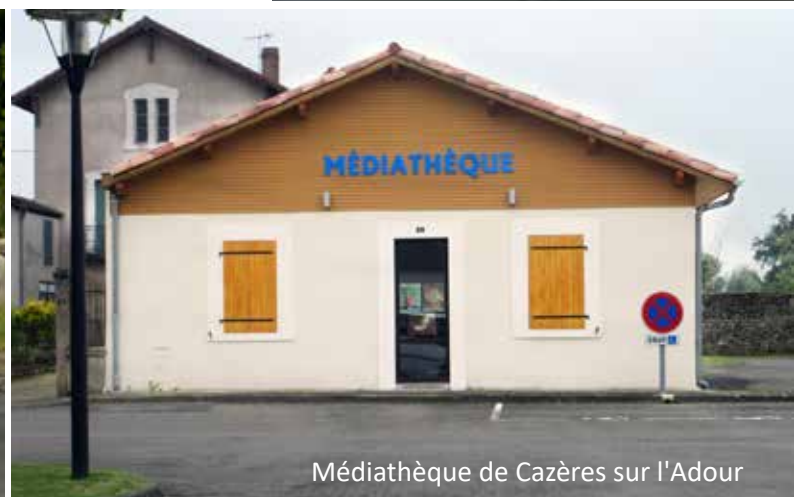
Médiathèque de Cazères sur l'Adour

"L'ambition globale est de définir des règles communes entre les différentes composantes du territoire communautaire, de partager les enjeux financiers et d'acter ce partage, d'assurer une plus grande transparence financière entre les communes sans porter atteinte à la libre administration de celles-ci."