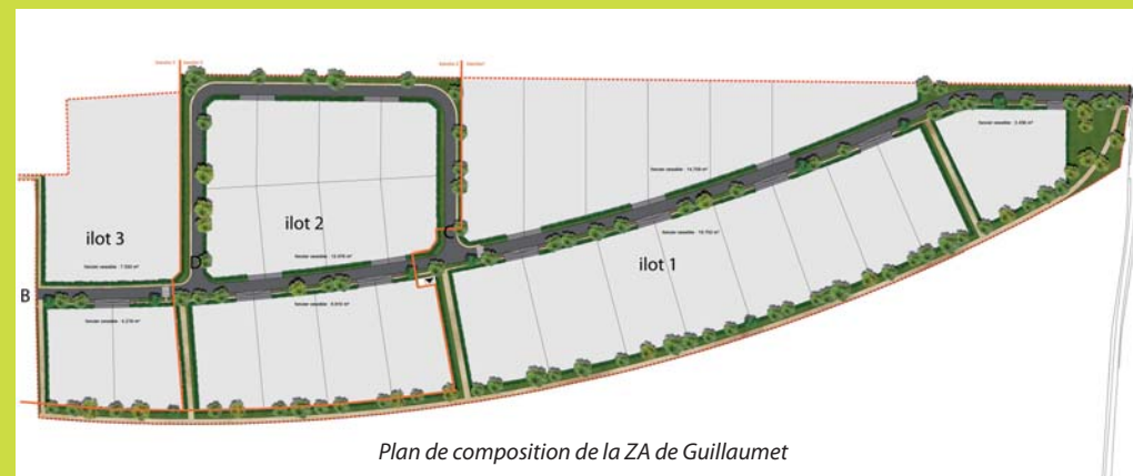
Plan de composition de la ZA de Guillaumet