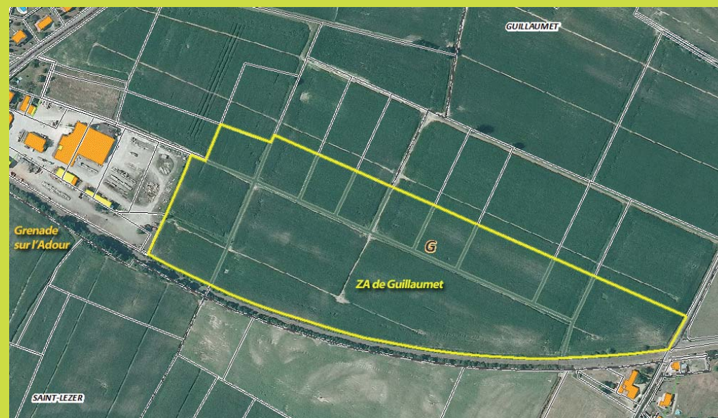
Vue aérienne de la zone d'activités de Guillaumet